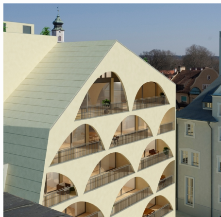
Visualisierung des „Neubaus“- Haus 2

Mit beeindruckenden Ausblicken über den Bodensee bis hin zu den Vorarlberger und Schweizer Bergen entsteht ein höchst kreatives und unverwechselbares Wohnensemble an begehrtester Lage auf der historischen Insel Lindau, direkt am Yachthafen.