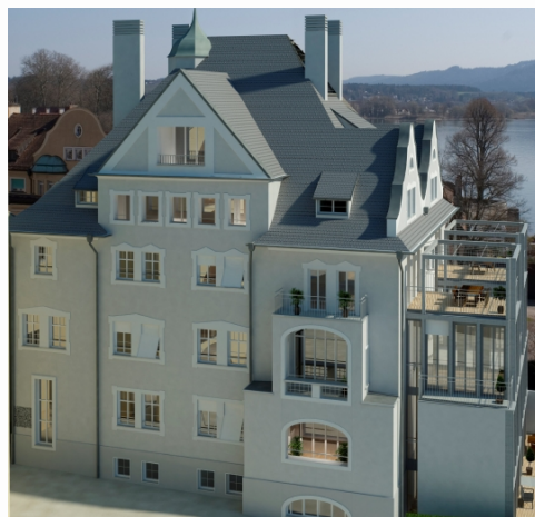
Visualisierung der „Villa“ (Westansicht)

Leben in Ferien – das ist die Devise. Die historische Inselstadt im Dreiländereck Deutschland, Österreich, Schweiz zählt zu den schönsten Orten in ganz Deutschland. Reges Treiben & Dolce Vita auf dem Hafenplatz mit kleinen Cafés, Restaurants, Händlern und Musikanten schaffen einen Hauch südlicher Romantik.