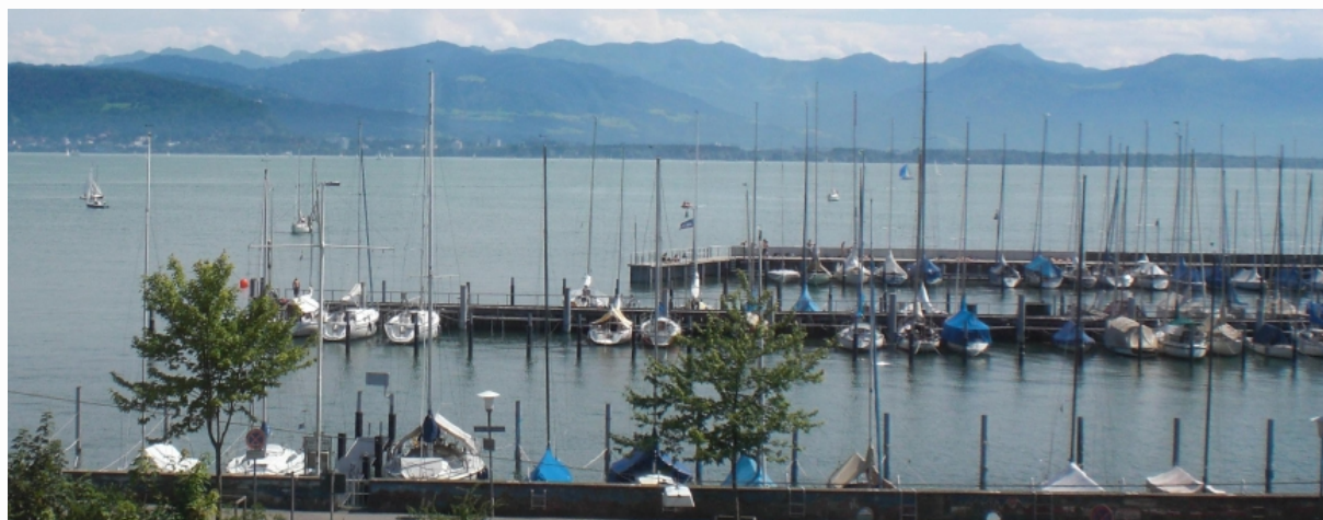
Aussicht aus dem OG 2 Neubau

Größtenteils gen Süden ausgerichtet und mit traumhaften Blick über den Bodensee und die Vorarlberger Alpen, bieten rund 32 einzigartige Eigentumswohnungen (65 bis 220 m 2 ) in direkter Nachbarschaft zur historischen Inselstadt höchste Lebensqualität in atemberaubender Aussichtslage.